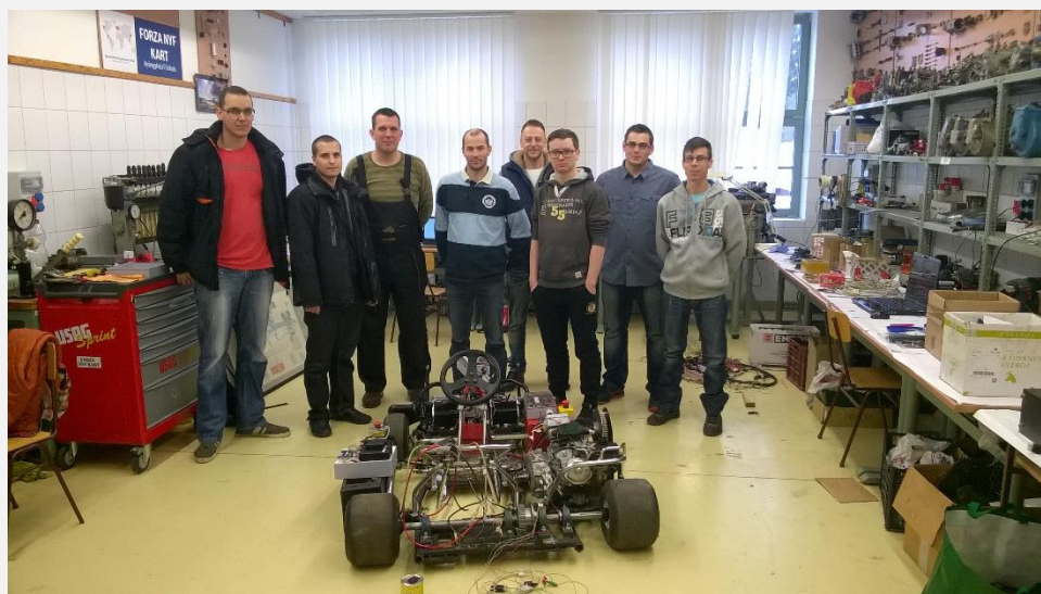
Autonóm gokart építés „Go-Kart, Go-Bosch 2016” Budapest abszolút VII. helyezés