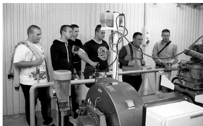
Az hallgatók motorfékpados mérésben vesznek részt

tárgyakat folytatnak. - A mezőgazdasági mérnök-képzésünk egyértelmű irányvonalat határozott meg magának, a fenntartható fejlődést tüztük ki a zászlajunkra.