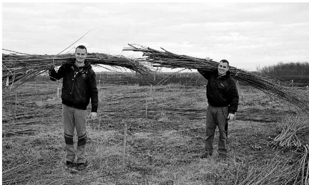
Az egyetem hallgatói az energiazöld betakarításakor