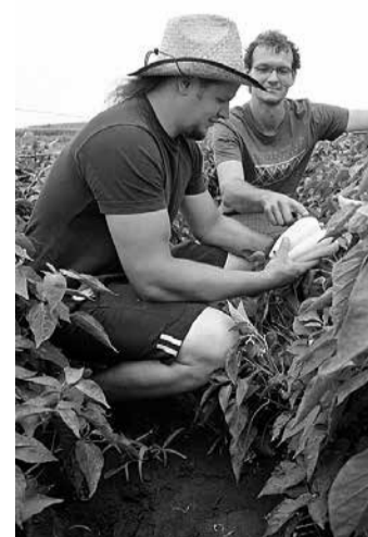
Betakarítás közben a fiatal gazdák ILLUSZTRÁCIÓ: ÉKN

- Ez utóbbi esetben a zöldsejgeknek hektáronként 67 000, ipari zöldsejgnél hektáronként 52 500, ültetvényeknél pedig hektáronként 96 000 forinthoz. Mindez évente az ágazat számára mintegy 10 milliárd forintot jelent évente 2020-ig - tette hozzá Feldman Zsolt. A helyettes államtitkár szövegéből is, hogy a Vidék-