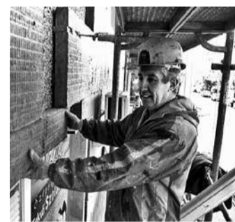
A szigetelés alternatív módszereit mutatják be ILLUSZTRÁCIÓ: KM

- A mostani programunk a közösségi összefogás adta lehetőségeket igyekeznek körbejárni. A társadalom mind nagyobb része szegényedik el, és ez a réteg ördögi körben találja magát. Képtelen ugyanis megfizetni az épületfelújítás költségeit, hiszen a jövedelmének